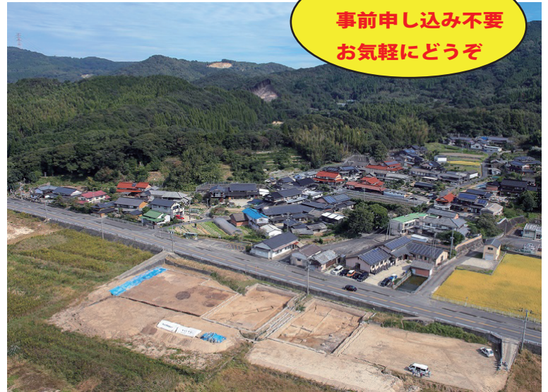
黒岩前田遺跡（唐津市相知町）