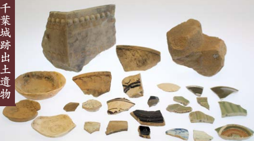
千葉城跡出土遺物